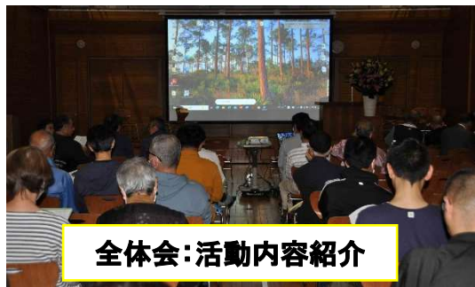
全体会:活動内容紹介