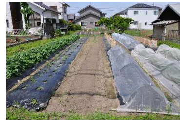
各部会の写真は、当日出席者のみの撮影になっています